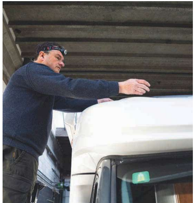
⤴ Het aluminium dak vertoont wat hagelschade.