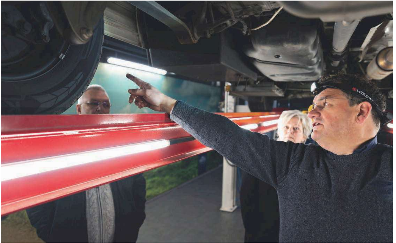
⤴ Van onderen ziet de camper er als nieuw uit.